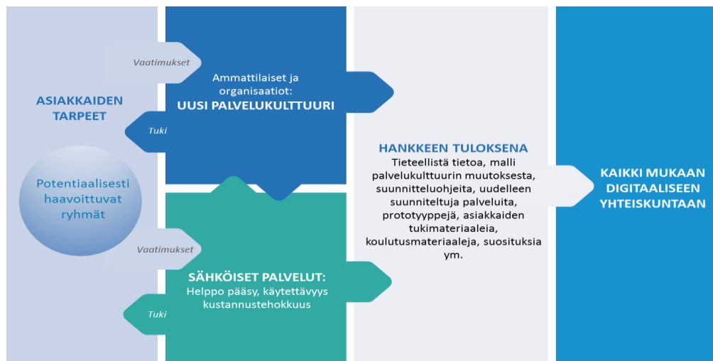
Kuva 2: DigiIN-hankkeen viitekehys

Hankkeemme panostaa tuottamaan tietoa eri elämänvaiheiden merkityksistä digitaalisten hyvinvointi- ja terveyspalveluiden käytössä. Selvitämme myös millaista kulttuurista muutosta tarvitaan, jotta digivälineiden käyttö on mahdollista toimintakyvyltään iäkkäiden ryhmämuotoisen terveysliikunnan edistämiseksi. Tähän liittyvän aikaisempaa tutkimusta on ollut toistaiseksi vaikea löytää vaikkakin erilaisia kokeiluja on ollut (Iltanen 2018).